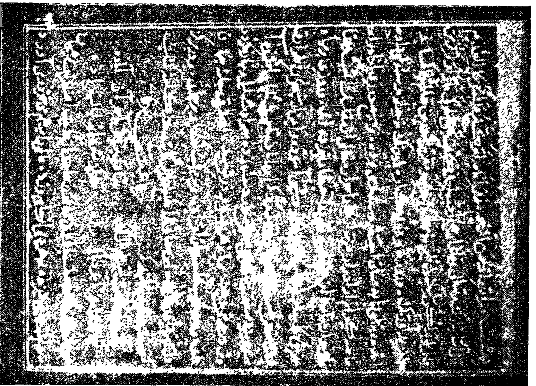
صورة للورقة الأولى من مخطوط « صلالة تسليمة الاخوان المصطفى بالكتابة الالهية بباريس